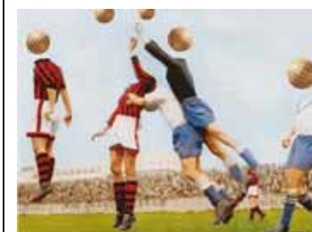
Une action incontestable.

«Petit lexique des belles erreurs de la langue française (et de Suisse romande)»: aux éditions Loisirs et Pédagogie SA, 272 pages, 28 francs. En vente en librairie.