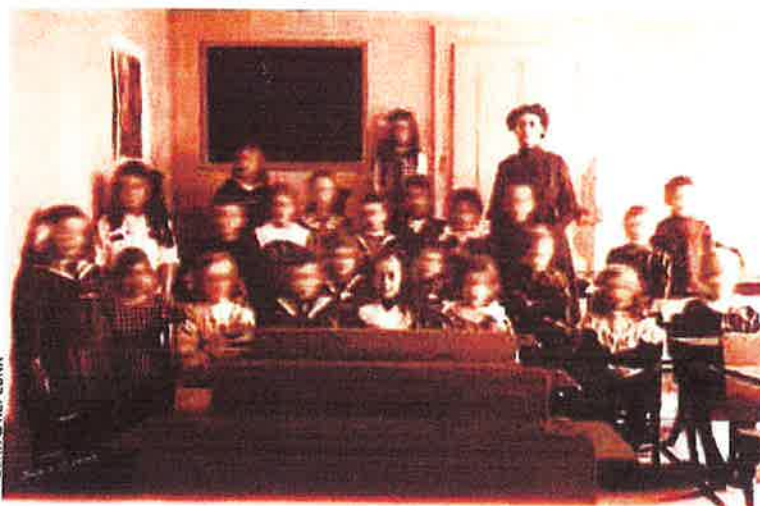
PLONK & REPLONK

La Poste les a évidemment vus passer, leurs cartes postales. Et Plonk et Replonk de se retrouver invités à à L'Adresse, le musée de La Poste. Pendant un an, ils vont détourner à leur guise tous les objets du patrimoine postal. Une reconnaissance pour deux artistes qui passent le plus clair de leur temps à flâner dans les vide-greniers et les brocantes, à la recherche de vieilles cartes ou photos de famille. Vient ensuite une recherche de bonnes phrases et